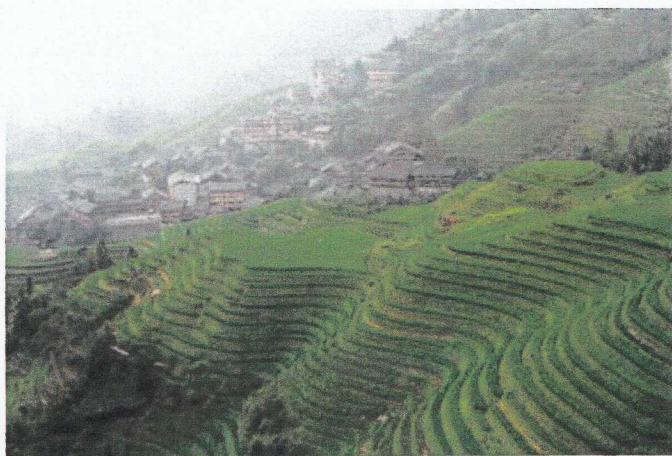
Rizières en terrasses de Longji (Guangxi).