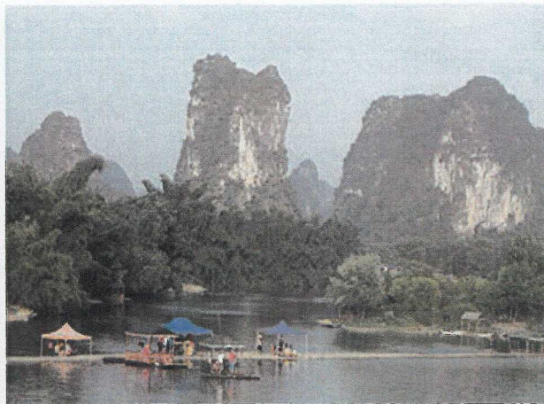
La rivière Li et les monts karstiques dans la région de Guilin (Guangxi).