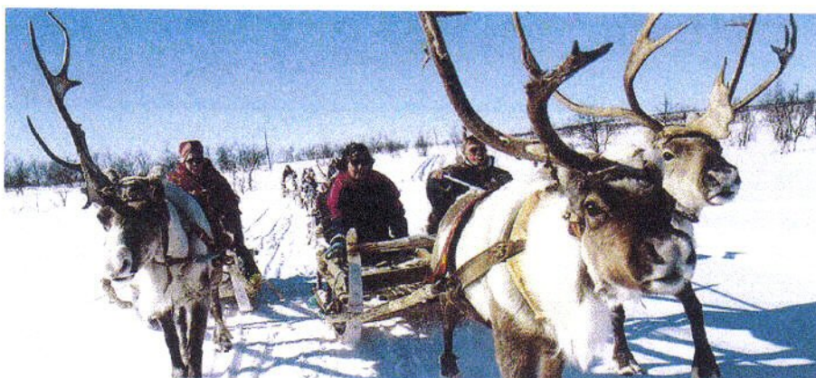
Attelage de rennes

Seul peuple d'Europe à vivre en majorité au nord du cercle polaire, les Lapons demeurent les représentants les plus occidentaux de la culture du renne, culture qui s'étend sur toute la bordure littorale arctique de l'Eurasie. Bien qu'ils soient à peine plus de trente mille en 1970, ils sont éparpillés dans tout le nord de la Fennoscandie, de l'arrière-pays de Trondheim à l'extrémité orientale de la presqu'île de Kola. Ils y cohabitent avec d'autres populations, généralement plus nombreuses, auxquelles ils tendent de plus en plus à s'intégrer. On compte environ vingt-deux mille Lapons en Norvège, six mille en Suède, moins de deux mille en Finlande. La plupart d'entre eux sont aujourd'hui bilingues (Encyclopédie Universalis).