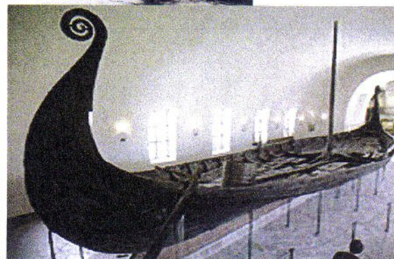
Musée des Bateaux Vikings à Bygdøy, Oslo

Seul peuple d'Europe à vivre en majorité au nord du cercle polaire, les Lapons demeurent les représentants les plus occidentaux de la culture du renne, culture qui s'étend sur toute la bordure littorale arctique de l'Eurasie. Bien qu'ils soient à peine plus de trente mille en 1970, ils sont éparpillés dans tout le nord de la Fennoscandie, de l'arrière-pays de Trondheim à l'extrémité orientale de la presqu'île de Kola. Ils y cohabitent avec d'autres populations, généralement plus nombreuses, auxquelles ils tendent de plus en plus à s'intégrer. On compte environ vingt-deux mille Lapons en Norvège, six mille en Suède, moins de deux mille en Finlande. La plupart d'entre eux sont aujourd'hui bilingues (Encyclopédie Universalis).