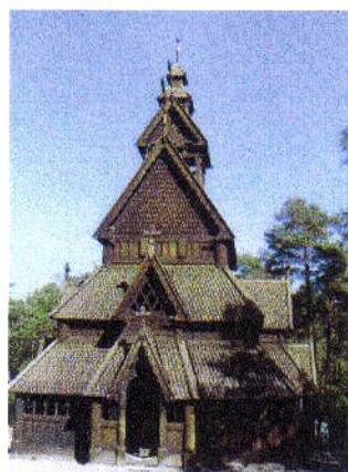
← stavkirke de Gol , église XIIIe siècle, Norwegian Folkmuseum, Bygdø à Oslo